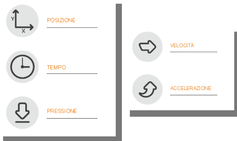
Fig.1 - Schema

Gli elementi disponibili nell'apposizione della sottoscrizione da parte del FIRMATARIO , sono i dati biometrici e comportamentali, quali: Posizione della penna, Pressione, Tratto in aria (percorso che fa la penna quando non tocca nel device, fino a 1cm ), e Tempo. E' possibile elaborare velocità e accelerazione ai fini di analisi forensi.