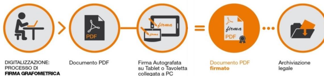
Fig.2 - Schema

I dati cifrati vengono successivamente inseriti nel pdf attraverso la creazione di una firma conforme allo standard europeo denominato PAdES. La soluzione prevede che, a sigillo di ogni firma apposta sul documento dal CLIENTE, sia applicato un certificato rilasciato da NAMIRIAL CA.